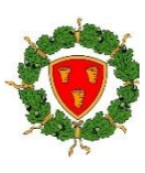
Comune di Trequanda